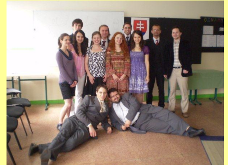
Po úspešnej maturitnej skúške