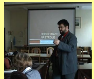
Prednáška pre učiteľov v Kysuckom Novom Meste

Najdôležitejšie body programu, s ktorými sa uchádzam o Vašu priazeň, nájdete zhrnuté na druhej strane tohto letáku. Vychádza z môjho doterajšieho poznania situácie mesta Gelnica a z mojich osobných schopností. Gelnicu som si obľúbil, ale vidím aj veľký priestor na zlepšenie . Iste, medzi kandidátmi bude mnoho tých, ktorí poznajú miestne pomery lepšie ako ja. Mojou výhodou je to, že poznám dobrú prax v iných častiach Slovenska a môžem ju ponúknuť aj nášmu mestu. Môj program nie je postavený na budovaní ciest, budov a námestí – lebo v tom nie je moja sila. Tu viem sľúbiť len to, že budem uprednostňovať kvalitné, hospodárne a čestné riešenia. Viem však ponúkať riešenia v oblasti vzdelávania, kultúry a systému riadenia mesta .