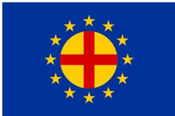
Vlajka paneurópskej únie

EÚ mala svojho predchodcu už v roku 1922, bola to Paneúropská únia, založená židom Dr. Richardom Nicolaus Coudenhove-Kalergi. Táto inštitúcia mala vo svojom členstve viacero prominentných židov, ktorí často vystupovali proti národom Európy a voči bielej majorite. Okrem iného k nej patrili i osoby ako Albert Einstein, Thomas Mann, Sigmund Freud, Franz Werfel, Fridtjof Nansen, Otto von Habsburg, Charles de Gaulle, Benedetto Croce, Aristide Briand, Konrad Adenauer, Franz Josef Strauss, Bruno Kreisky, Léon Blum, Georges Pompidou.